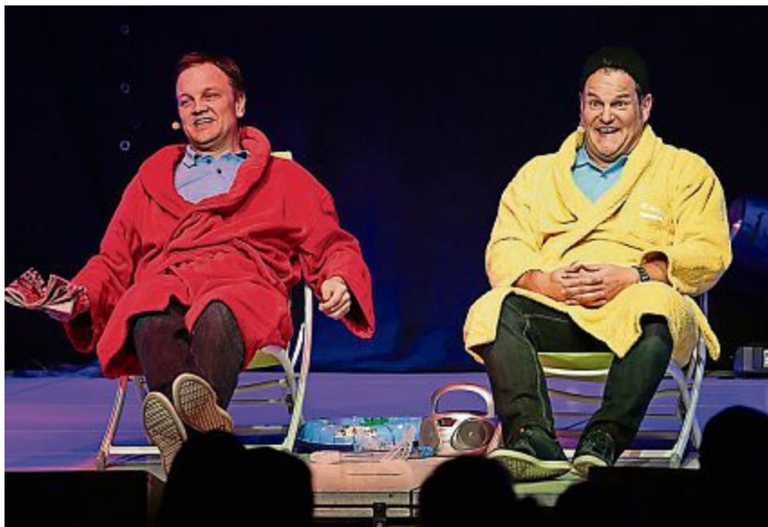
Das Komikerduo «mir zwe» in Aktion.

Viel Wissenswertes sowie Ticketreservierungen gibt es auf der Künstler-Homepage unter www.zwe.ch/pd