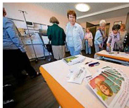
Hier werden die intravenösen Therapien bei Multipler Sklerose oder anderen entzündlichen Erkrankungen des Nervensystems durchgeführt. Das Neurozentrum hat fünf Überwachungsplätze.